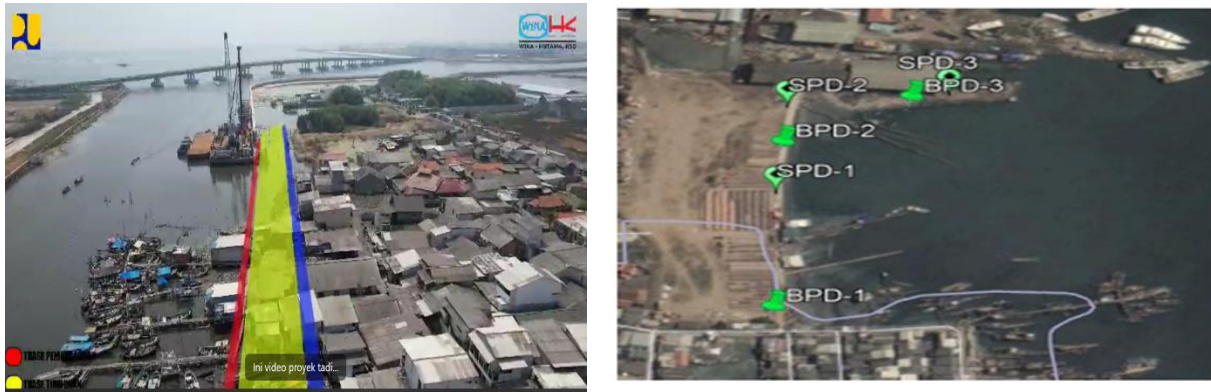
Gambar 1. Lokasi pemancangan