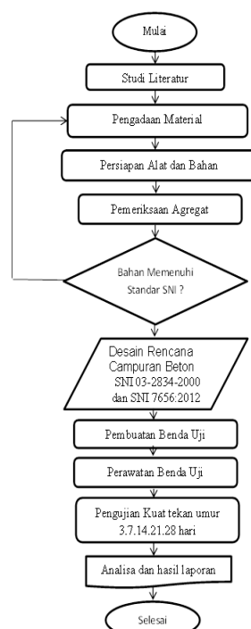
Gambar 1 Diagram Rancangan Campuran Beton